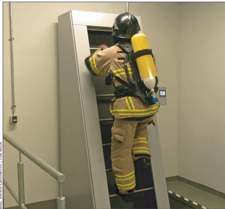
Belastungsübung für Atemschutzgeräteträger auf der Endlosleiter

fe in der Ferne und Nähe und das Hörvermögen untersucht. Zur Einschätzung der Leistungsfähigkeit des Herz-Kreislauf-Systems werden außerdem ein Ruhe-EKG und ein Fahrradbelastungstest durchgeführt. Aus allen Untersuchungsergebnissen stellt der durchführende Arzt fest, ob eine gesundheitliche Eignung besteht.“