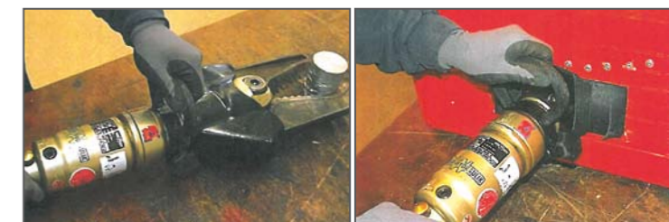
Die Splitterschutzbox der Kreisfeuerwehrentrale Steinburg im Einsatz bei der Prüfung der hydraulischen Rettungsschere

Auslegen von Rollschläuchen. Die Gewinner erhielten ihre Preise aus den Händen von Vertretern der jeweilig zuständigen Feuerwehr-Unfallkasse. Der FUK-Dialog gratuliert allen Preisträgern herzlich und wünscht weiterhin viele gute Ideen für die Feuerwehr-Sicherheit!