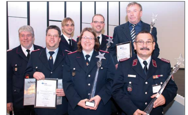
Die stolzen Gewinner des Präventionspreises der Feuerwehr-Unfallkassen

Der dritte Platz ging an den Kreisfeuerwehrverband Steinburg in Schleswig-Holstein. Die Mitarbeiter der dort ansässigen Kreisfeuerwehrentrale hatten eine Splitterschutzbox entwickelt, mit der die Schneidkraftprüfung der hydraulischen Rettungsscheren gefahrloser durchführen lässt. In der Vergangenheit war es bei den Prüfungen wiederholt zum Absplit-