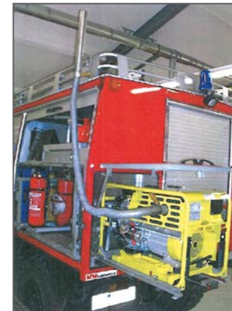
Verlängerter Abgasschlauch der FF Ilten

Den ersten Platz sicherte sich die FF Erfurt-Gispersleben, die mit ihrem Projekt eines improvisierten Wasserwerfers, der nahezu ohne Stolperfallen auskommt, überzeugen konnte.